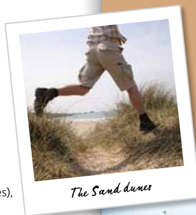
The Sand dunes

Faites le tour du promontoire, puis tournez à gauche le long du chemin qui suit le bas-côté de la route jusqu'à La Pulente, où vous pouvez vous arrêter pour prendre une boisson bien méritée ! Vous pouvez