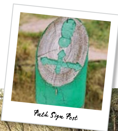
Path Sign Post

Le terrain où vous vous promenez est un mélange de routes et de sentiers qui peuvent être boueux parfois, donc vous devez être équipé pour les marches.