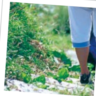
Chemin côtier de pied

Après vous être désaltéré, remontez la colline jusqu'au deuxième virage à gauche. Cherchez la piste qui se trouve à droite et qui monte en traversant le National Trust Woodland (l'endroit boisé du National Trust). Vous passerez aussi devant un 'lavoir', qui se trouve au bout de La Rue des Fortunées, où le ruisseau traverse le chemin. Puis continuez jusqu'à la route. Tournez à gauche et suivez le chemin qui bifurque à droite, jusqu'à l'intersection en T (La Rue de la Fontaine). Tournez à droite (La Rue de la Petite Falaise), puis prenez le premier tournant à gauche le long de La Rue du Presbytère. Le chemin de retour passe devant la Salle Paroissiale et l'église, en vous menant vers le pub qui s'appelle le Trinity Arms.