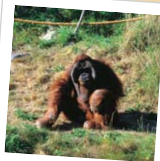
Orang-utans at Durrell

Continuez tout droit le long de la Rue de la Fosse, en passant devant l'entrée du Manoir Diélament, qui se trouve à droite. Ce dernier est un des Fiefs restants à Jersey, dont les Seigneurs doivent toujours assister chaque année à l'assemblée d' 'Assize d'Héritage' pour confirmer leur allégeance à la Couronne, en comparissant devant le Lieutenant Gouverneur.