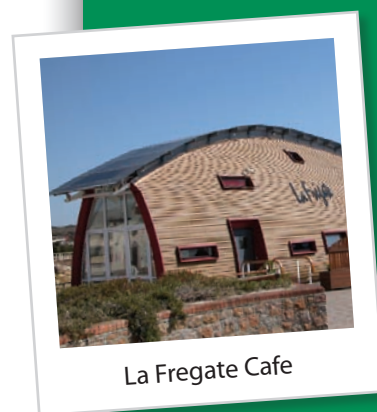
La Fregate Cafe