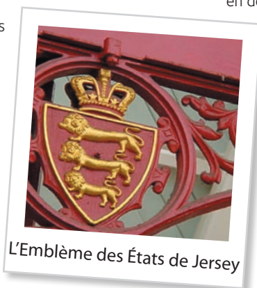
L'Emblème des États de Jersey

La promenade commence et finit sur le Royal Square , passe devant l'église de la ville, le long de Pier Road jusqu'à Fort Regent et Mount Bingham. Elle continue en descendant sur Havre des