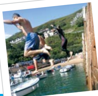
Bonne Nuit, Pier Jumping

Toutes les deux promenades principales commencent et finissent à l'église, au cœur de la paroisse, vous menant le long des chemins et des pistes côtières de l'est et de l'ouest respectivement. Une des promenades est d'environ 5.5 milles de long et l'autre d'environ 4.5 milles, avec une distance supplémentaire de 3 milles si vous allez jusqu'au lieu qui s'appelle Sion. Le terrain comprend des routes, des pistes et des sentiers donc on vous conseille de porter des chaussures adéquates.