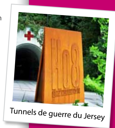
Tunnels de guerre du Jersey