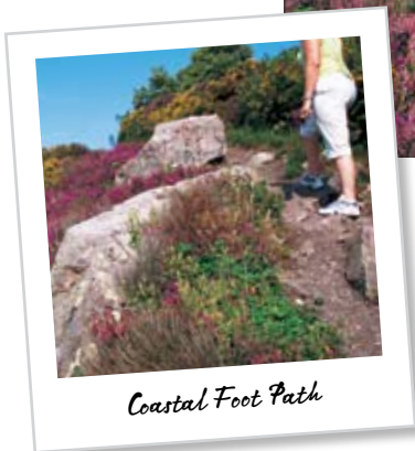
Coastal Foot Path

les toits en chaume étaient interdits à St Hélier au début du dix-huitième siècle et ils devenaient de moins en moins populaires à la campagne à mesure que le savoir disparaissait.